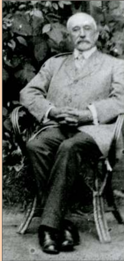
Папа сидит в саду около дома.