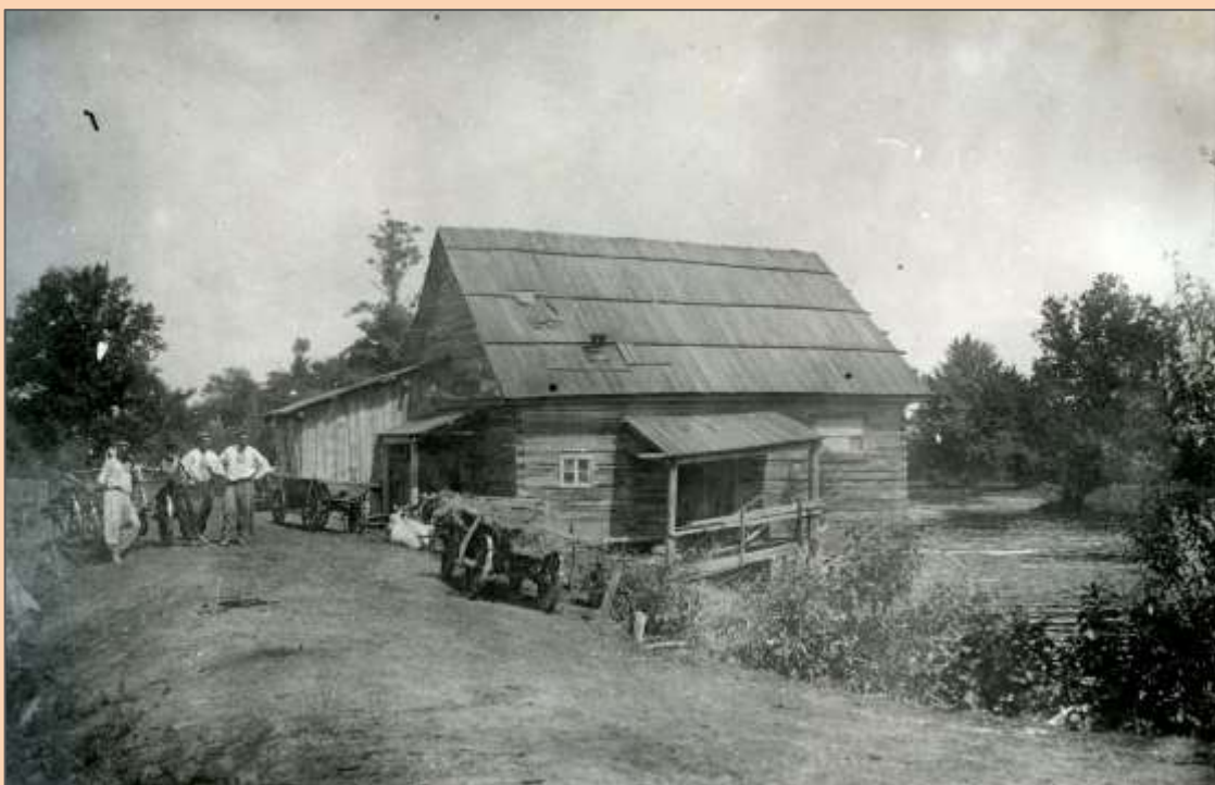
Водяная мельница на реке Ирша в Деревне Белый Берег.

Мухина. На реке в центре деревни стояла водяная мельница, обслуживающая не только деревню, насчитывавшую не больше ста хат, но и соседние деревни. Мельница стояла у плотины очень живописной реки Ирша, окруженной ивами и с небольшими мостами через протоки. У меня сохранились съемки этих мест: на одном 100-летний старик-крестьянин, одетый в белую домотканую одежду с кошельком за спиной, идет по плотине; на другом снимке - я у мостика плотины. Жили в д. Белом Береге, главным образом, бывшие шляхтичи - крестьяне, занимаясь сельским хозяйством на своих песчаных, неплодородных землях. На ст. Ирша, при желании, многие могли найти приработок.